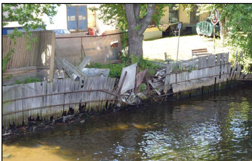
Фото 2. р. Ждановка.